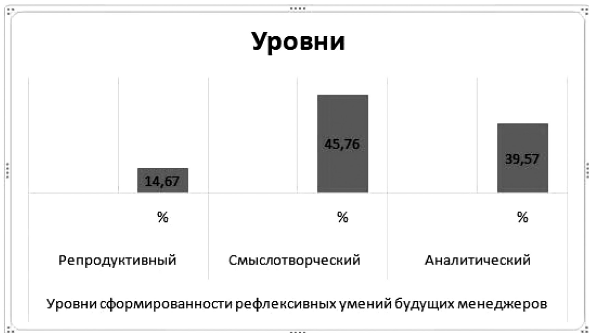
Рис. 2. Результаты сопоставления двух методик диагностики уровня сформированности рефлексивных умений будущих менеджеров на контрольном этапе эксперимента Fig. 2. Results of interpolation of two methods of diagnostics of the level of formation of reflexive skills among future managers at the control stage of the experiment

Заключение. Таким образом, разработанные организационно-педагогические условия формирования рефлексивных умений будущих менеджеров в системе среднего профессионального образования обеспечили качественный рост уровня сформированности рефлексивных умений студентов.