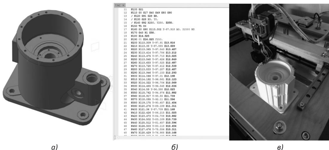
Рис. 3. Реализация проекта: а) 3D-модель; б) управляющая программа; в) прототип детали Fig. 3. Project implementation: a) 3D-model; b) control program; c) prototype of a detail

Студентами была выполнена 3D-модель в программе Kompas, механическая обработка перенесена в управляющую программу для станков с программным управлением. Для демонстрации результатов проектирования был изготовлен прототип детали на 3D-принтере из пластикового прутка. Проект был реализован для