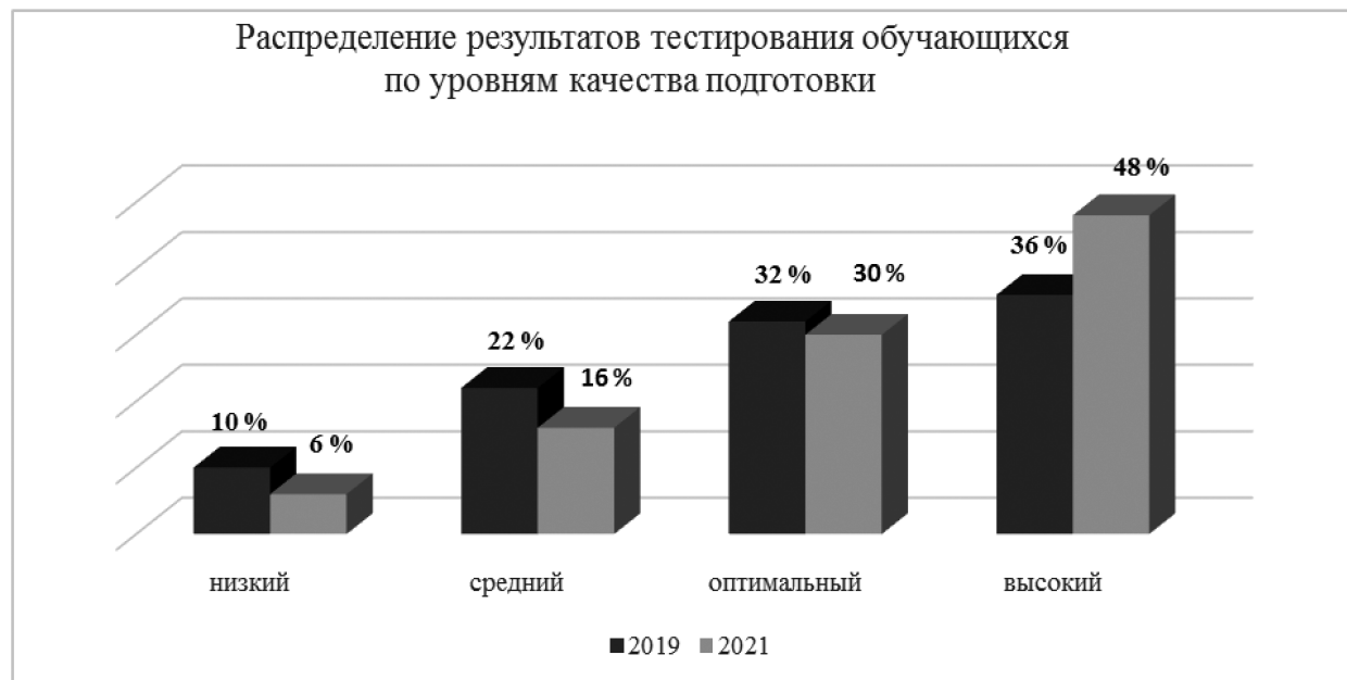
Рис. 4. Результаты оценки уровня подготовки обучающихся Аэрокосмического колледжа по результатам ФЭПО

В результате прохождения тестирования в колледжа показали результаты, представленные на диаграмме (рис. 4).