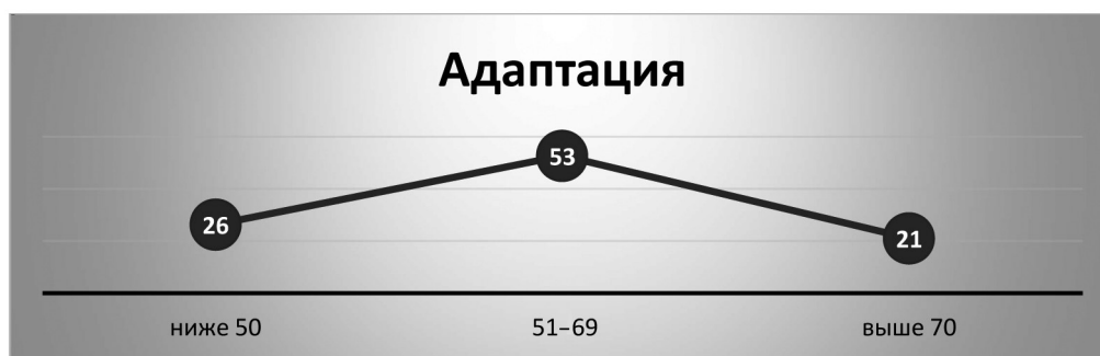
Рис. 1. Интегральные показатели адаптации по методике СПА Fig. 1. Integral indicators of adaptation according to the Test of Personal Adjustment

общества, культуры, образовательной структуры, быта и другое. Первичная адаптация сопровождается «шоковым» состоянием, вызванным информационной и эмоциональной перегрузкой, бытовой адаптацией. Все эти факторы отражаются в негативном восприятии или непринятии окружающей среды. Следствием этих процессов являются разочарование, фрустрация и депрессия – критерии четвертой стадии аккультурационного стресса.