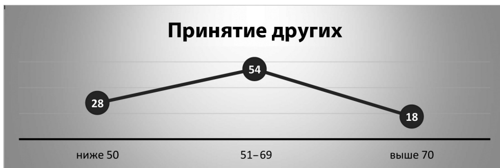
Рис. 3. Интегральные показатели принятия других по методике СПА Fig. 3. Integral indicators of acceptance of others according to the Test of Personal Adjustment

Из рис. 3 видно, что по шкале «Принятия других» \frac{1}{4} студентов имеют индекс ниже среднего, \frac{1}{2} – в диапазоне 51–69 баллов. Половина опрошенных студентов находятся в принятии себя,