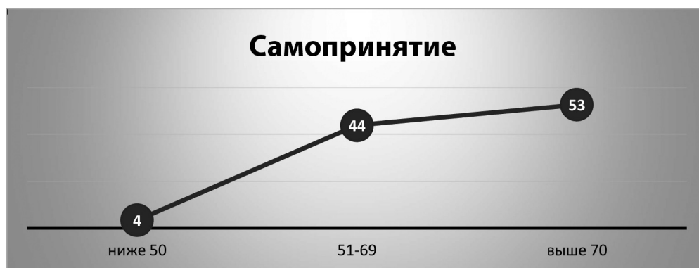
Рис. 2. Интегральные показатели самопринятия по методике СПА Fig. 2. Integral indicators of self-acceptance according to the Test of Personal Adjustment

группа студентов, успешно прошедших первичную адаптацию, с положительной динамикой академической успеваемости, социализирующихся в новой среде. Данное состояние характерно для переходного этапа от депрессии в стабилизацию.