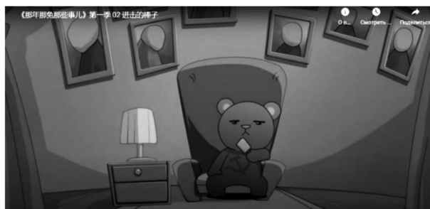
Рис. 3. Скриншот китайского мультипликационного фильма 那年那兔那些事儿 с изображением России в образе медведя Fig. 3. Screenshot of the Chinese animated film 那年那兔那些事儿 featuring Russia as a bear