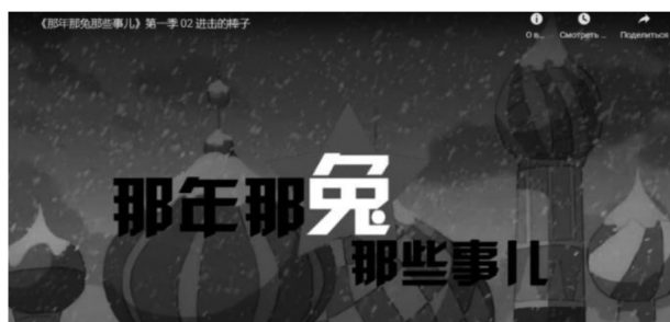
Рис. 2. Скриншот заставки китайского мультипликационного фильма 那年那兔那些事儿

правила дорожного движения (22 % опрошенных). Иностранцы (14 % студентов) считают, что россияне злоупотребляют алкоголем. Большая часть опрошенных студентов отмечают, что Россию всегда изображают в виде бурового медведя на фоне снега. Поддержанию этого факта способствует популярный китайский мультипликационный фильм 那年那兔那些事儿. В нем рассказывается об исторических событиях XX в. в мире, главные герои – животные, которые символизируют различные государства. Россия представлена холодной и снежной, ее образом является бурый медведь, который часто ленив и очень зол (рис. 2, 3).